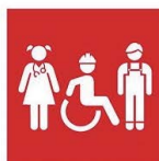
4.4. Competencias para acceder al empleo