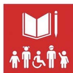
4.5. Igualdad de género y colectivos vulnerables