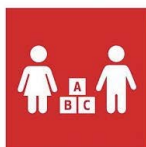
4.2. Acceso y calidad educación preescolar