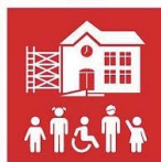
4.A. Instalaciones educativas inclusivas y seguras