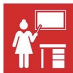
4.C. Mejora cualificación docente