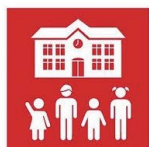
4.1. Calidad educación primaria y secundaria