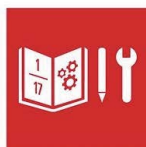
4.3. Acceso igualitario formación superior