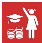
4.B. Becas para enseñanza superior