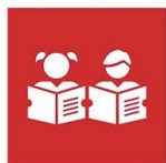
4.6. Alfabetización y conocimiento de la aritmética